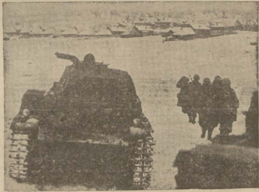
Karlarla kaplı bir Rus köyünün methalinde Alman zırlı kuvvetleri

İtalyanlar bu muntakada büyük zayıflık vermişlerdir. Bir İtalyan tank il yası bütün tanklarını kaybetmiştir. Almanlar Feodosyayı geri aldıkları hakkında iddia bulunmuşlarsa da bu keyfiyet henüz teyid edilmemiştir.